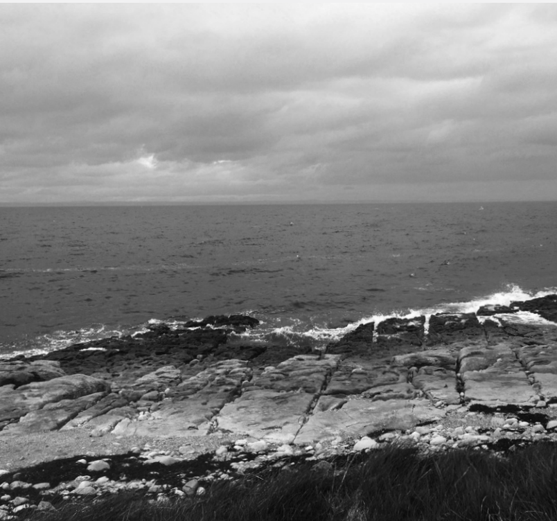
The Flaggy Shore, Condado Clare, Irlanda